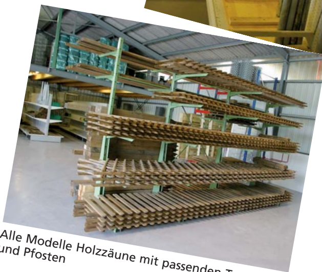
Alle Modelle Holzzäune mit passenden Toren und Pfosten