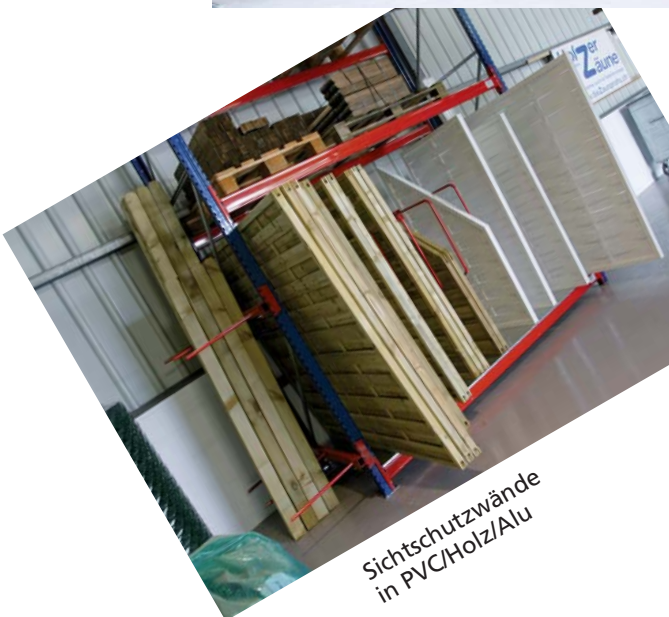
Sichtschutzwände in PVC/Holz/Alu