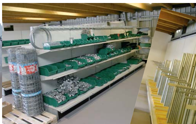
Alles für Metallzäune und Metallgeländer, auch in Chromstahl