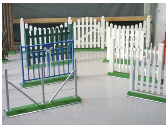
Alu-Zäune und -Geländer pulverbeschichtet